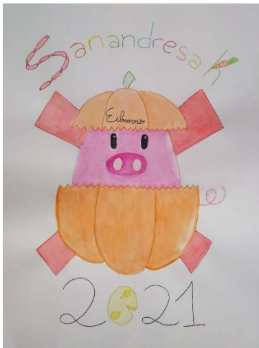
Itziar Eiriz (Eibar), "xerriak kalabazan"