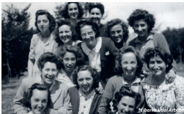
Las socias de GOI ARG.

gratuita y podían participar todas las mujeres y jóvenes que quisieran, sin excepción y sin necesidad de asociarse. GOI ARG también se convirtió en un espacio para que las mujeres hicieran amistades. En aquella época no era nada habitual ver a un grupo de chicas en una corrida de toros, en la calle o en una cafetería, sin hombres.