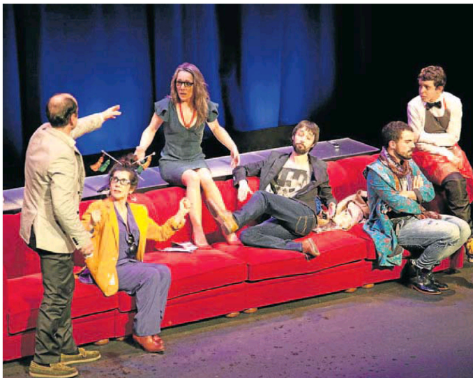
Vaivén Producciones estará en el Coliseo el día 24 con su montaje 'Terapiak'. :: E. C.