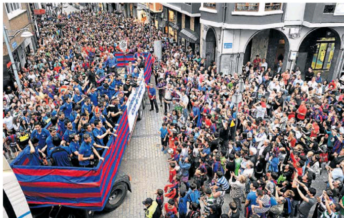
Las calles de Eibar volvieron a vibrar con el ansiado ascenso a Segunda.