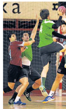
Eibar Eskubaloia. :: F. M.